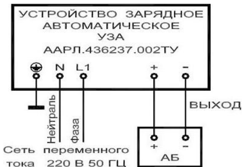
Рисунок 2 -Схема соединения УЗА

6.2.8 Цепи постоянного тока прокладывать отдельно от цепей переменного тока предпочтительно отдельными экранированными жгутами и кабелями. Пересечение проводов по возможности избегать. Если пересечение избежать нельзя, то оно должно проходить под углом 90°.