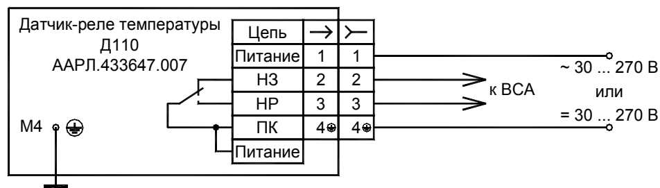
Рисунок 2 - Схема подключения Д110.

5.4 Датчик должен быть заземлен согласно требованиям ПУЭ.